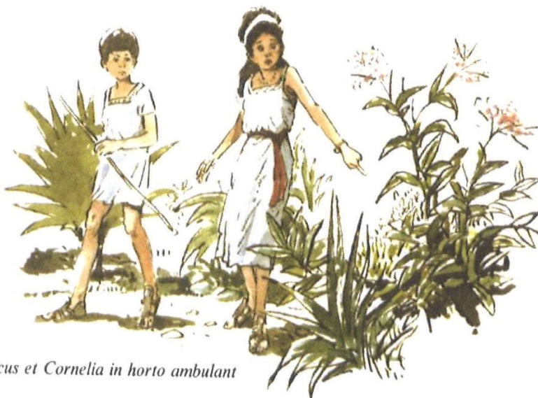
Marcus et Cornelia in horto ambulant

tum puer et puella clamant: „pater! pater! serpentem in horto vidēmus!”